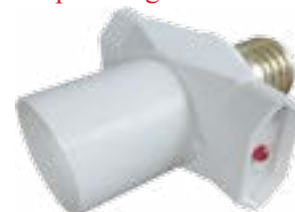
Adapter do gniazda E-27