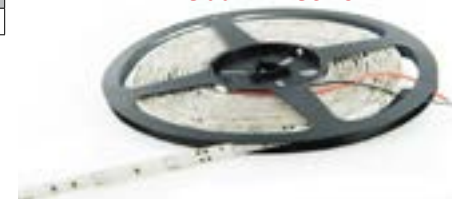
TAŚMA 300 LED3528 - 24 W