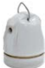
Oprawa ceramiczna z uchwytem ZAWIESZKA