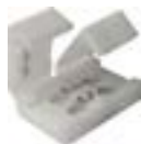
Złączka do taśmy LED