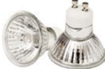
Żarówka halogenowa z odbłyśnikiem JDR 230V