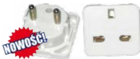
Adapter podróżny - angielski