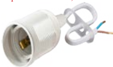
Oprawa termoplastyczna E27 z przewodem 2 x 0,75mm 2