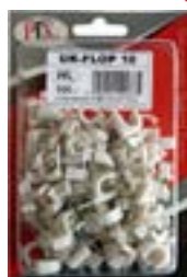
Uchwyt kablowy FLOP do przewodu płaskiego