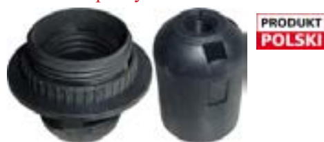
Oprawka termoplastyczna do żarówki