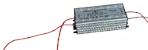
Zasilacz do taśmy LED 230V / 12V