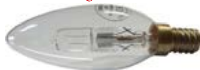
Żarówka halogenowa świeczka EKO