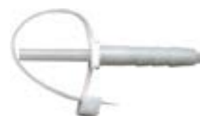
Uchwyt kablowy z opaską i kołkiem