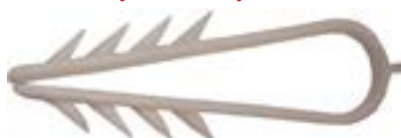
Uchwyt kablowy HOLDER