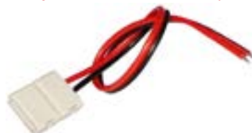
Złączka jednostronna do taśmy LED