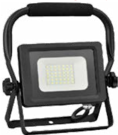
Naświetlacz LED SMD 5000K 2400lm IP65 1,5 m przenośny