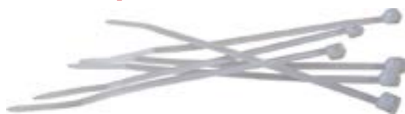
Opaska kablowa standardowa biała