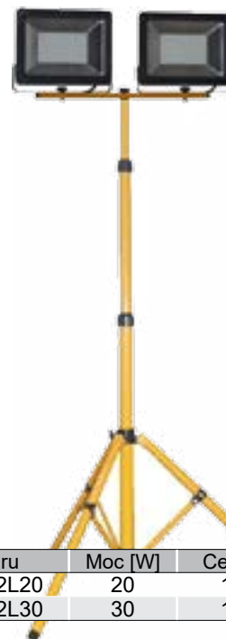
Podwójny stojak z dwoma naświetlaczami LED