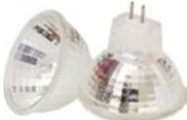
Żarówka halogenowa z odbłyśnikiem MR16 12V / JC DR 230V