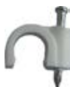
Uchwyt kablowy FLOP do przewodu okrągłego