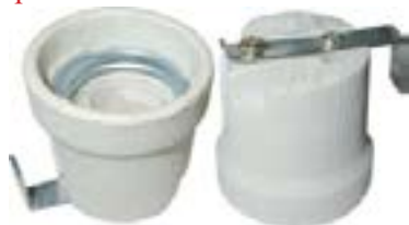
Oprawka do żarówki ceramiczna